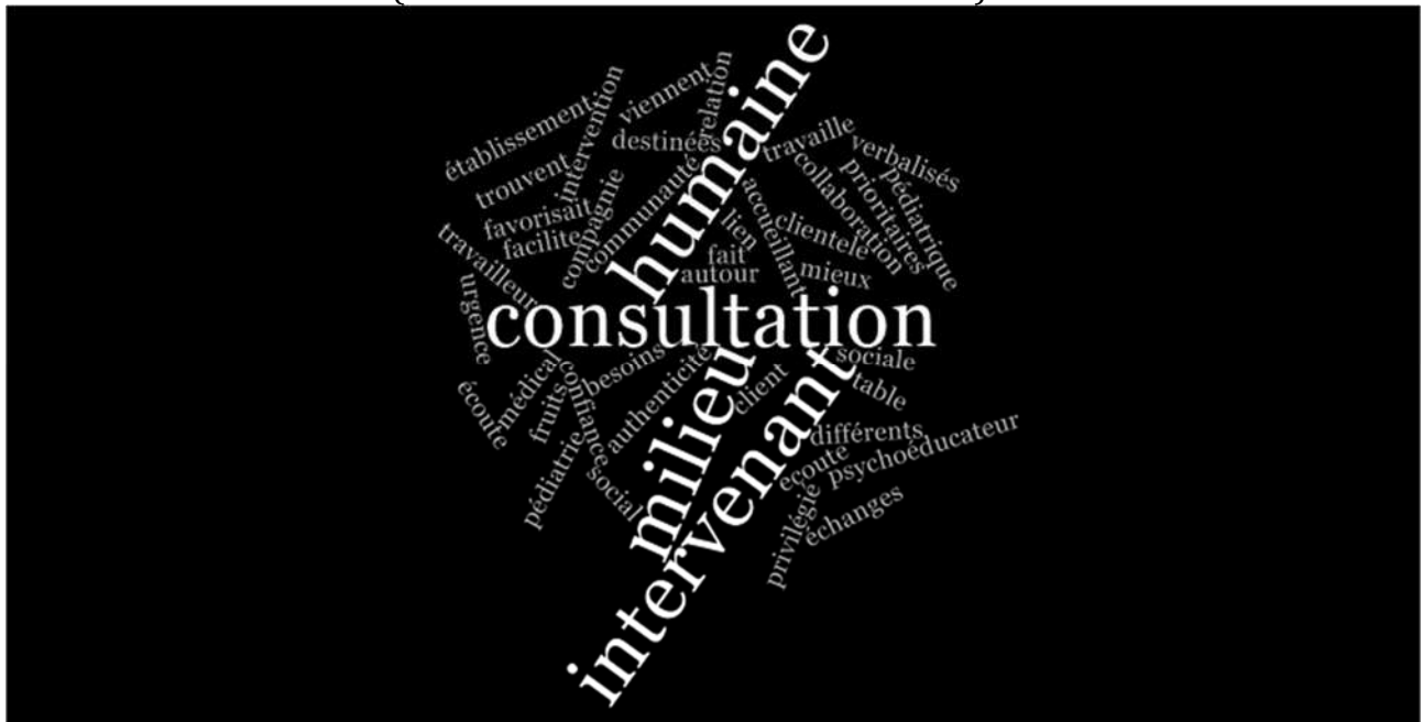
Fréquence de mots dans le nœud NVivo (pour le thème) « Différences notées entre PSC et autres contextes d'intervention/Qualités liées à l'approche patient, à l'écoute, à l'authenticité des intervenants, au lien de confiance établi avec les familles »

Aussi, les qualités liées à l'approche patient, à l'écoute, à l'authenticité des intervenants ont souvent été mentionnées (n=7 dont 4 infirmières et 3 étudiantes).